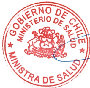
XIMENA AGUILERA SANHUEZA MINISTRA DE SALUD